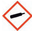
Gas unter Druck